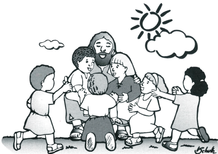
Para Jesus, as crianças são tão capazes de receber o Reino, que ele as coloca como exemplo para seus discípulos. (Mc 10.15)

4. Caso se estabeleça uma idade ideal a partir da qual as crianças podem participar da Eucaristia, voltar-se-ia a argumentar com critérios que se baseiam na capacidade cognitiva da pessoa. A participação deveria depender da própria congregação e da forma como ela entende o fato de ser uma comunidade cristã.