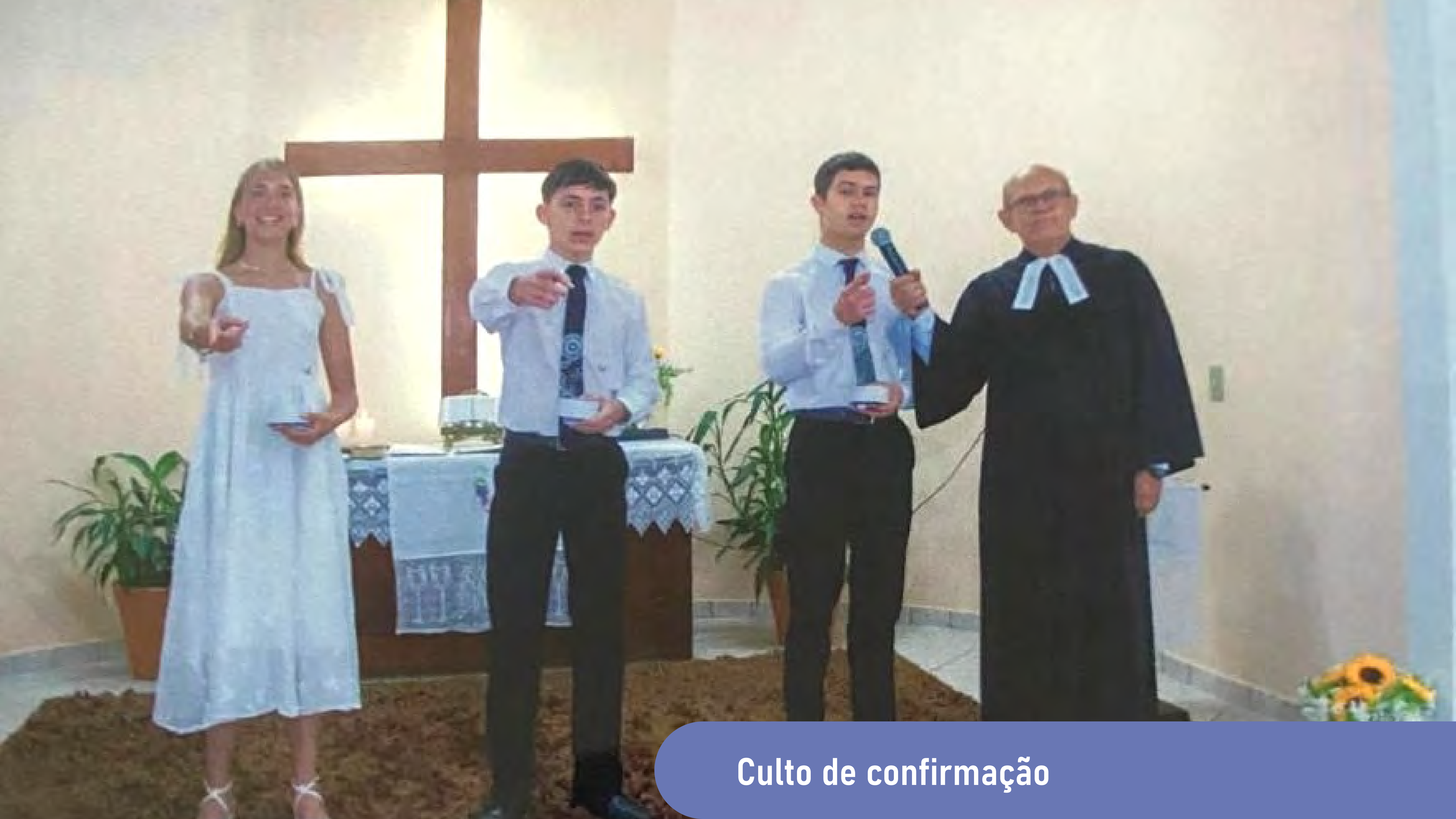
Culto de confirmação