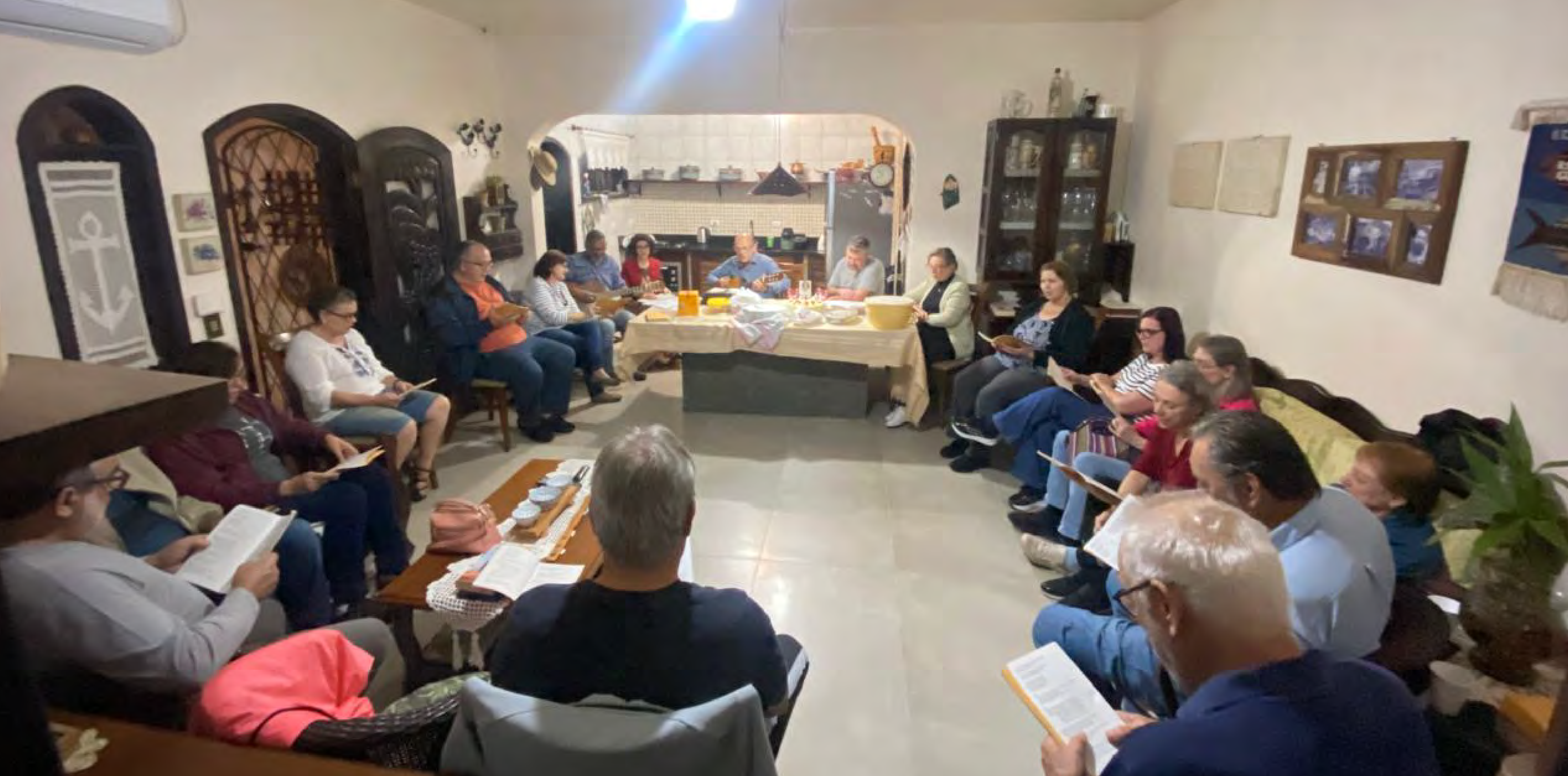
Estudo bíblico semanal