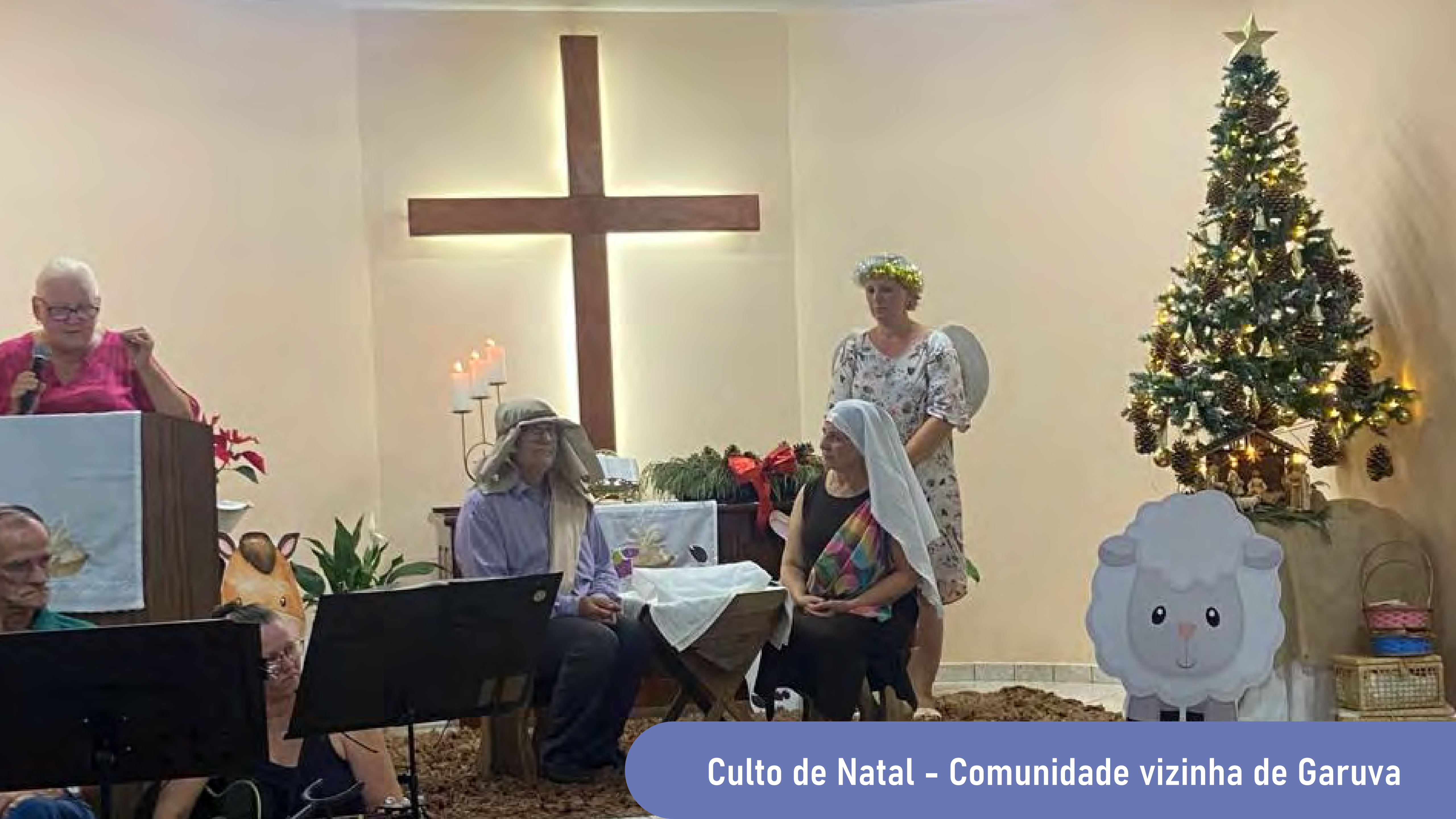
Culto de Natal - Comunidade vizinha de Garuva