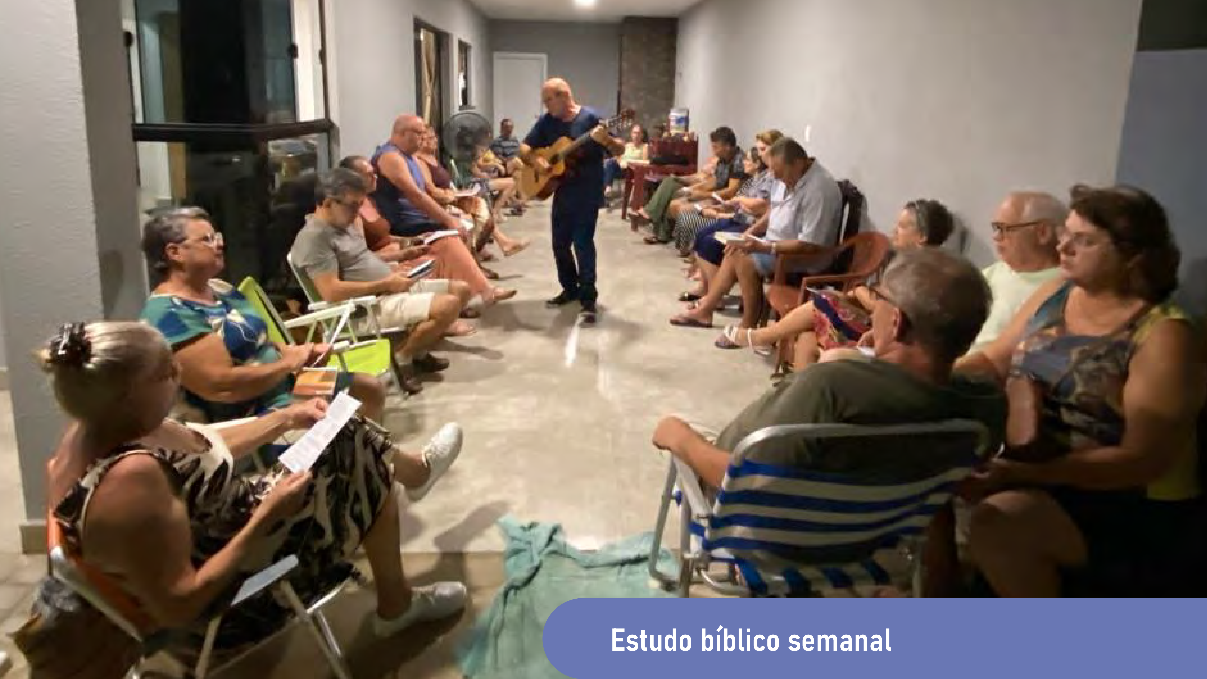
Estudo bíblico semanal