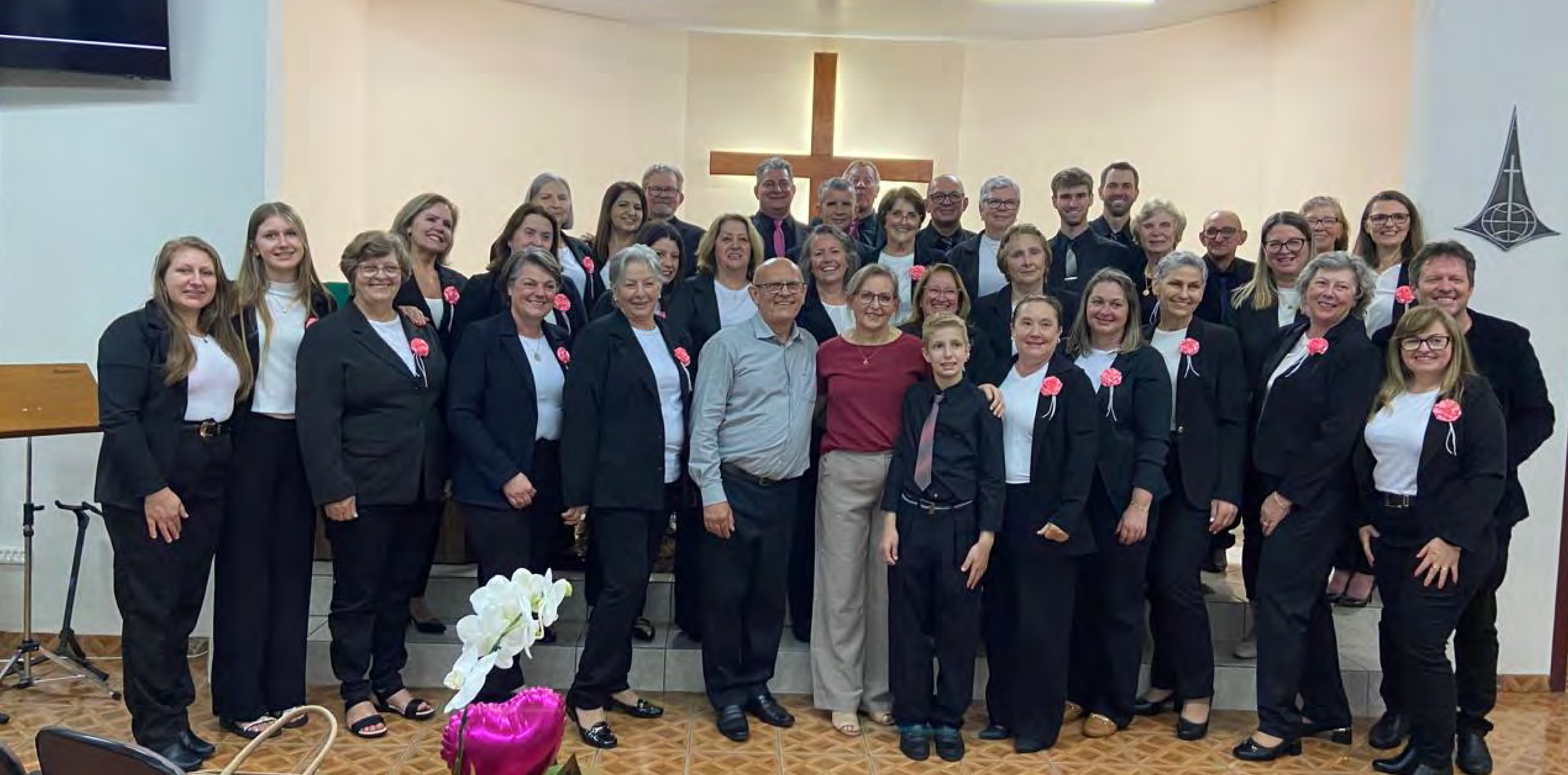
Visita do Coral Encanto da Paróquia de Trombudo Central