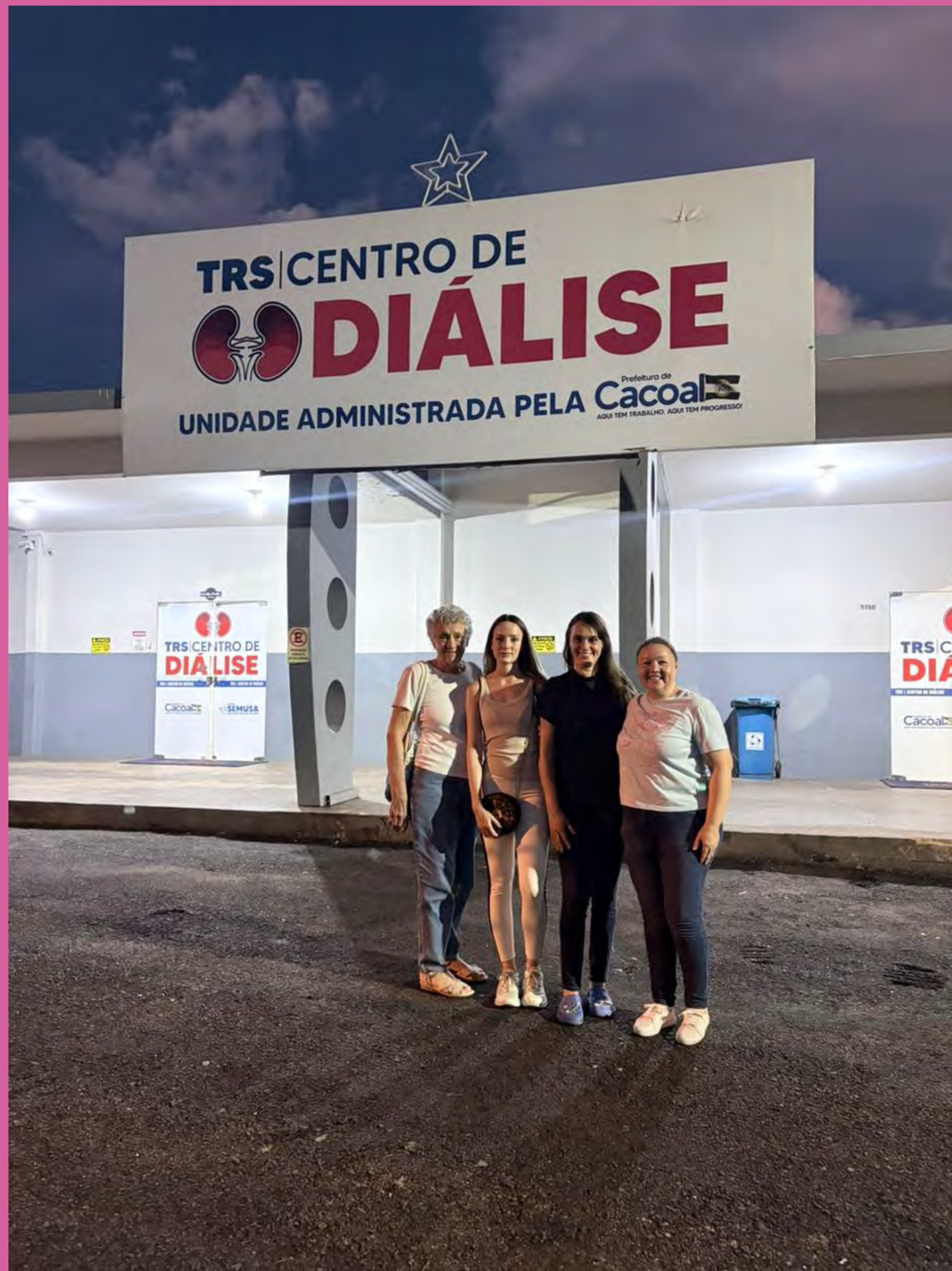
Visitas de Páscoa Centro de Diálise de Cacoal