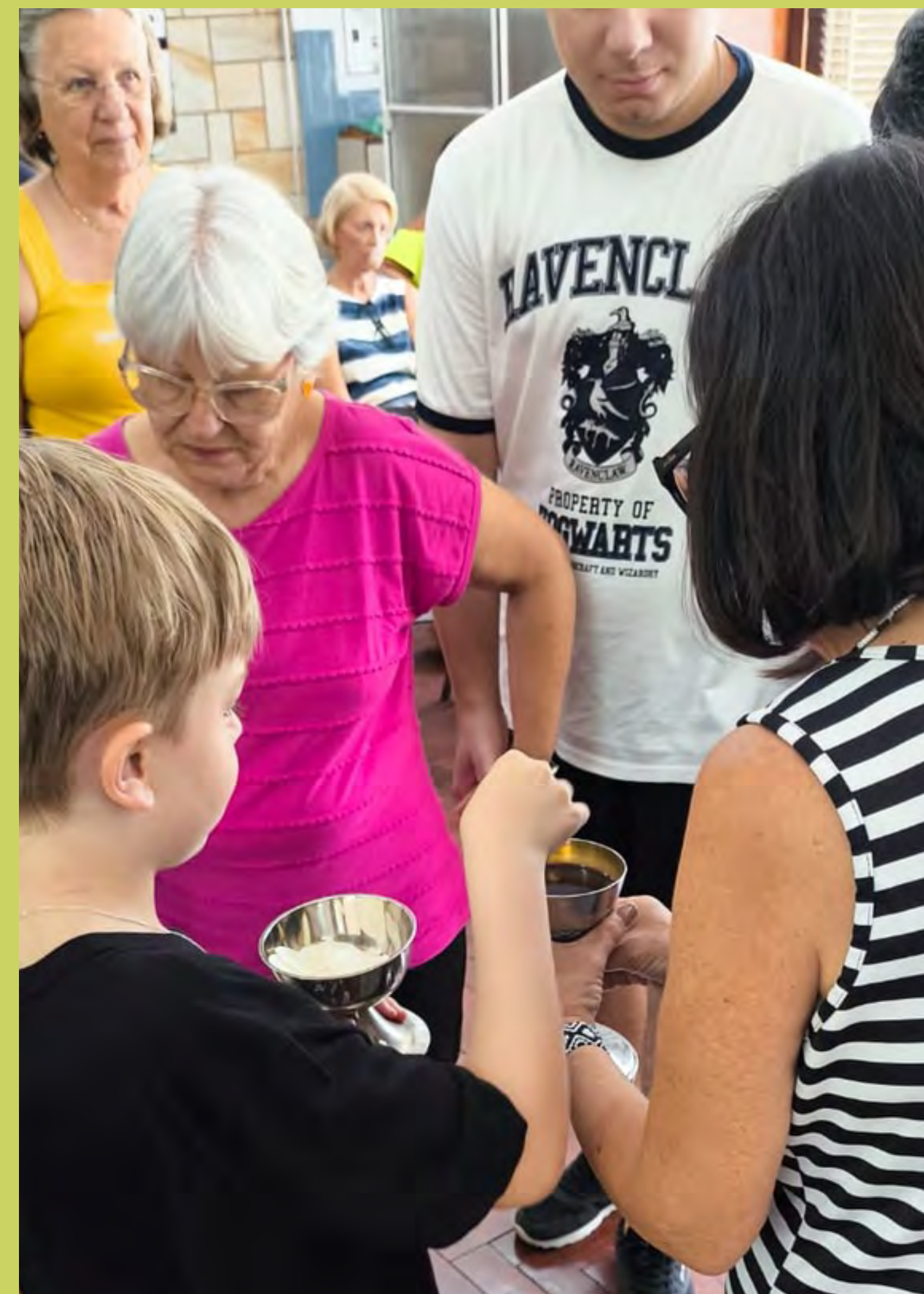
Comunhão sendo distribuída