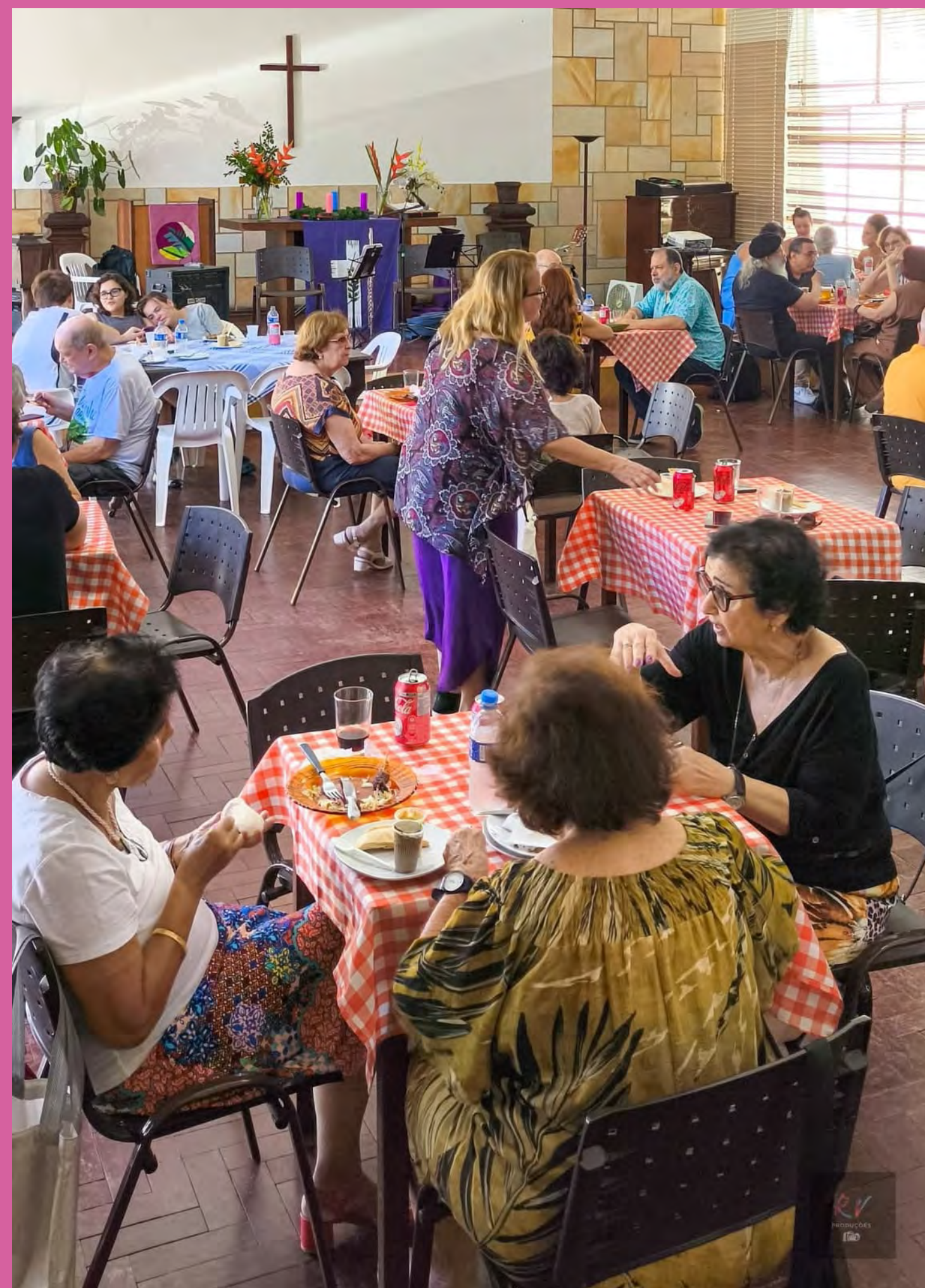
Almoço na comunidade em um domingo de advento (2025)