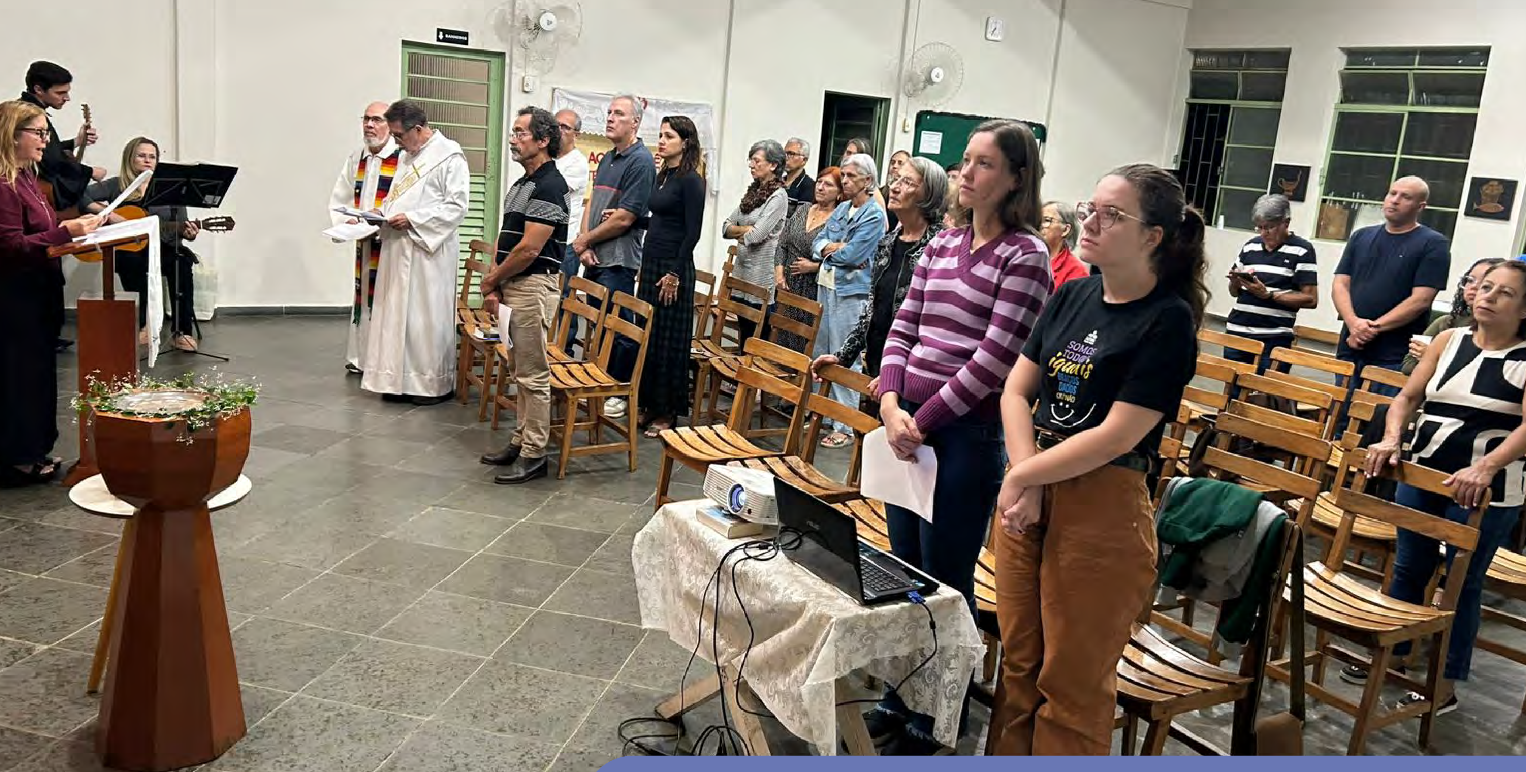
Culto SOUC (Semana da Oração pela Unidade Cristã)