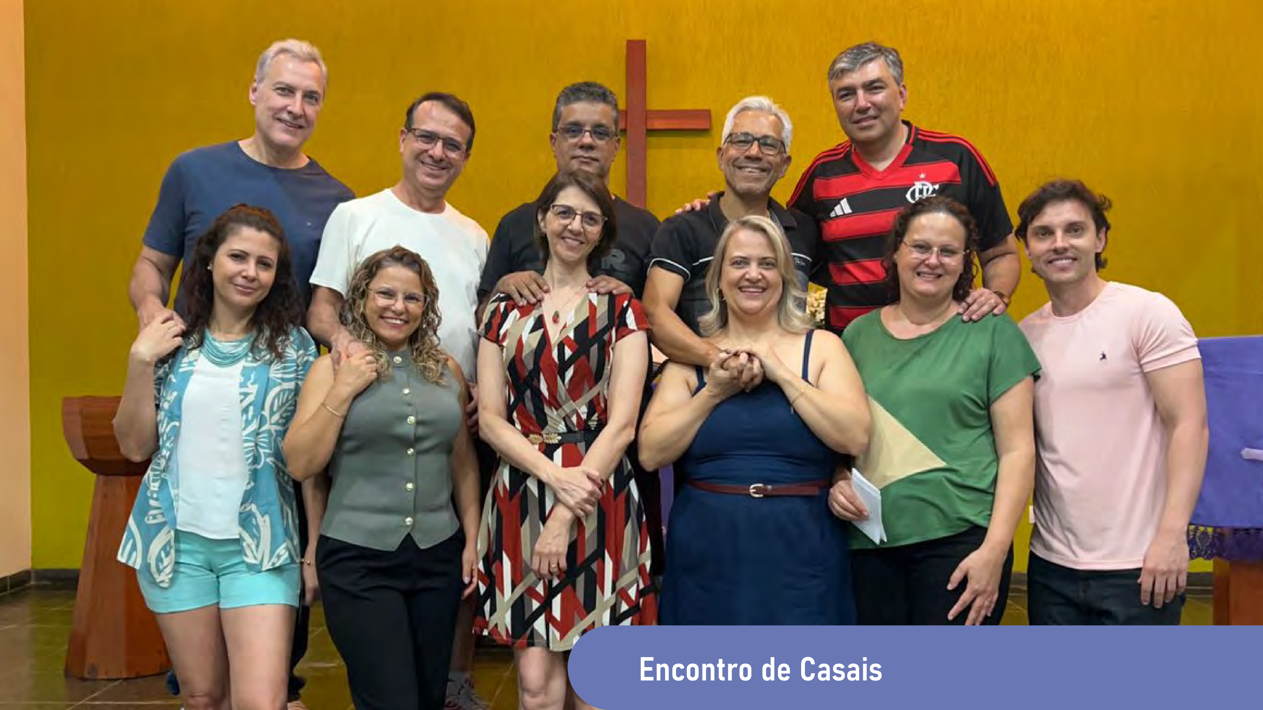
Encontro de Casais