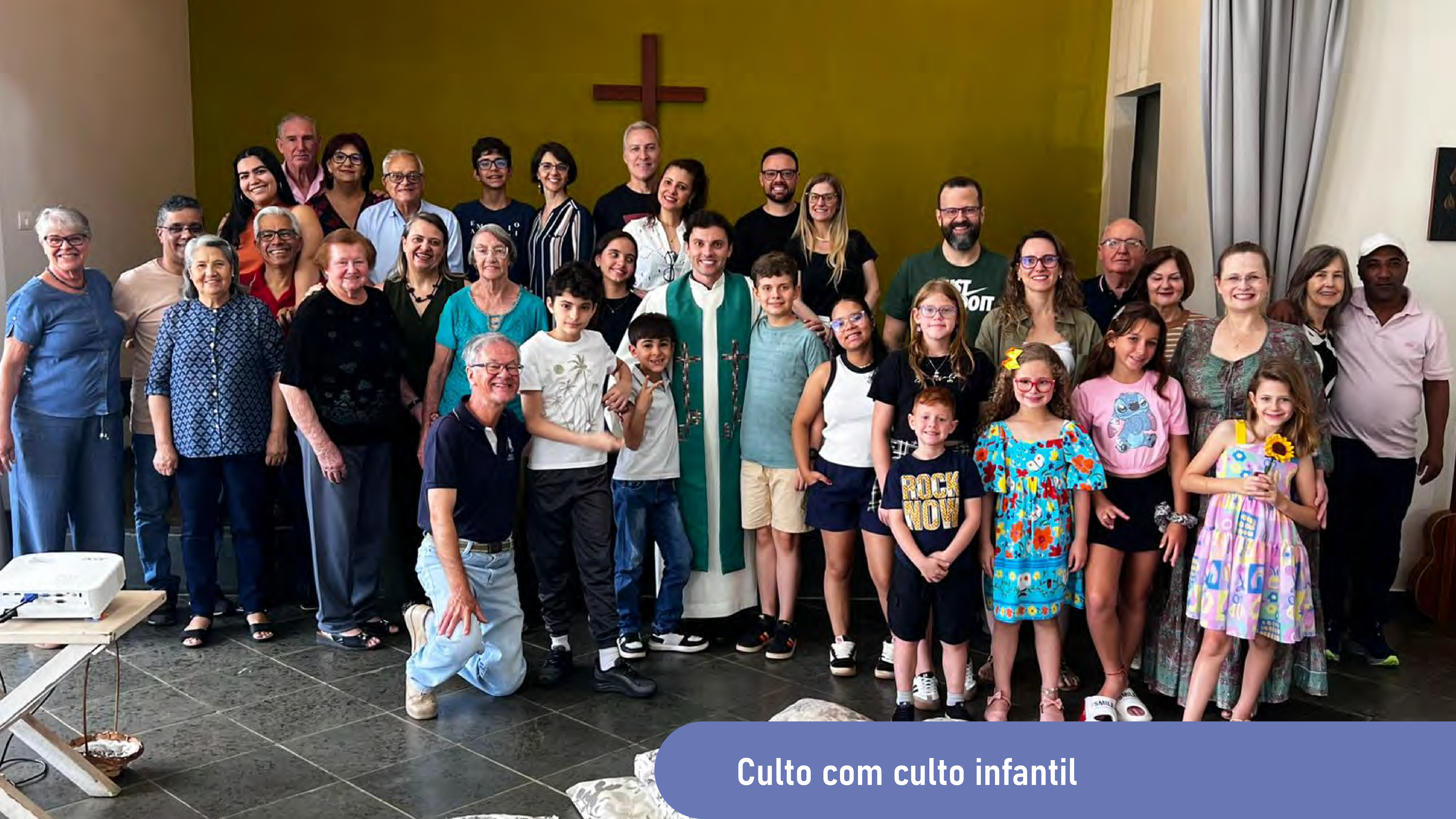
Culto com culto infantil